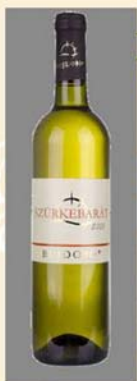
B 布吉多索·灰比诺 2009 Bujdosó • Pinot Gris 2009

酿造这款出色的葡萄酒用的葡萄是产自于宝崆亚巍嘉登山上的哈拉兹缇家庭酒庄，在这个家庭酒庄生产的酒是基于传统方法和现代技术的混合物，该酒的特点是特别甜美的口味和香味。