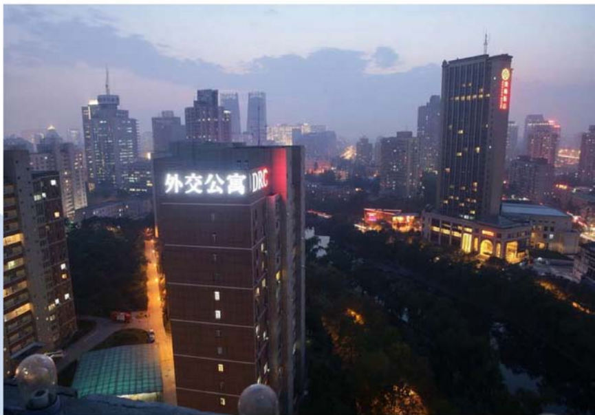
各国驻京外交人员及外国企业高管居住与办公的首选之地——外交公寓