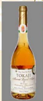
托卡伊·贵腐麝香 阿斯祖 6P 2000 Tokaji • Muscat Lunel Aszú 6 puttonyos 2000

这款酒的产地坐落于海拔285米南巴拉顿葡萄酒产区的最高峰，酒香主要基调以荔枝和玫瑰为主，柠檬黄色酒液，充满成熟桃子的香气，并伴随蜂蜜的气息，入口圆润丝滑，并有适中的酸度，甜而不腻，是佐餐亚洲美食的绝佳搭配。